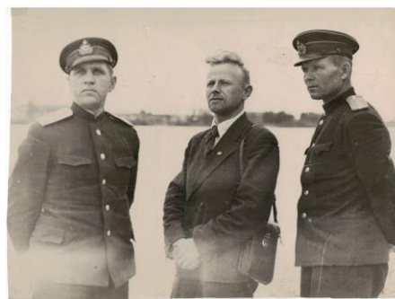
Военная приемка. Завод №477